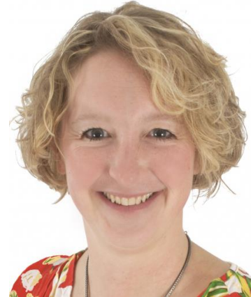
Pauline den Burger Jeugd